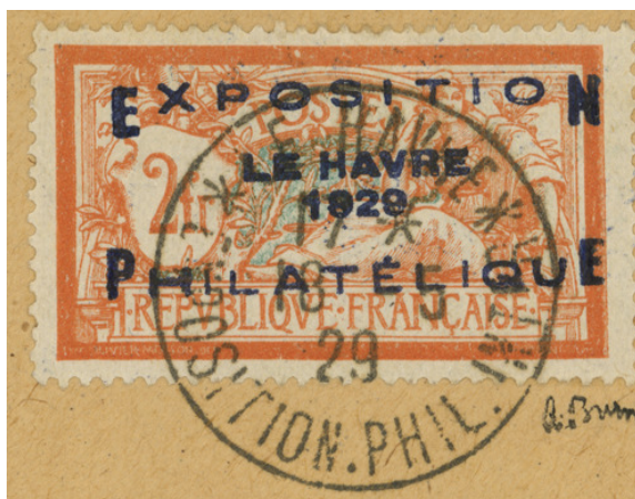
Le timbre falsifié.