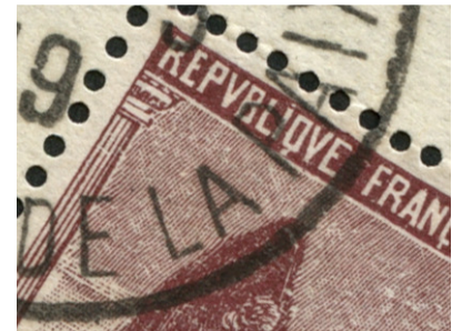
Détail oblitération authentique.

Cette fausse oblitération a également été apposée sur des timbres de faibles valeurs, ce qui permet au vendeur de mauvaise foi, ou incompetent, de montrer que toutes les oblitérations sont identiques.