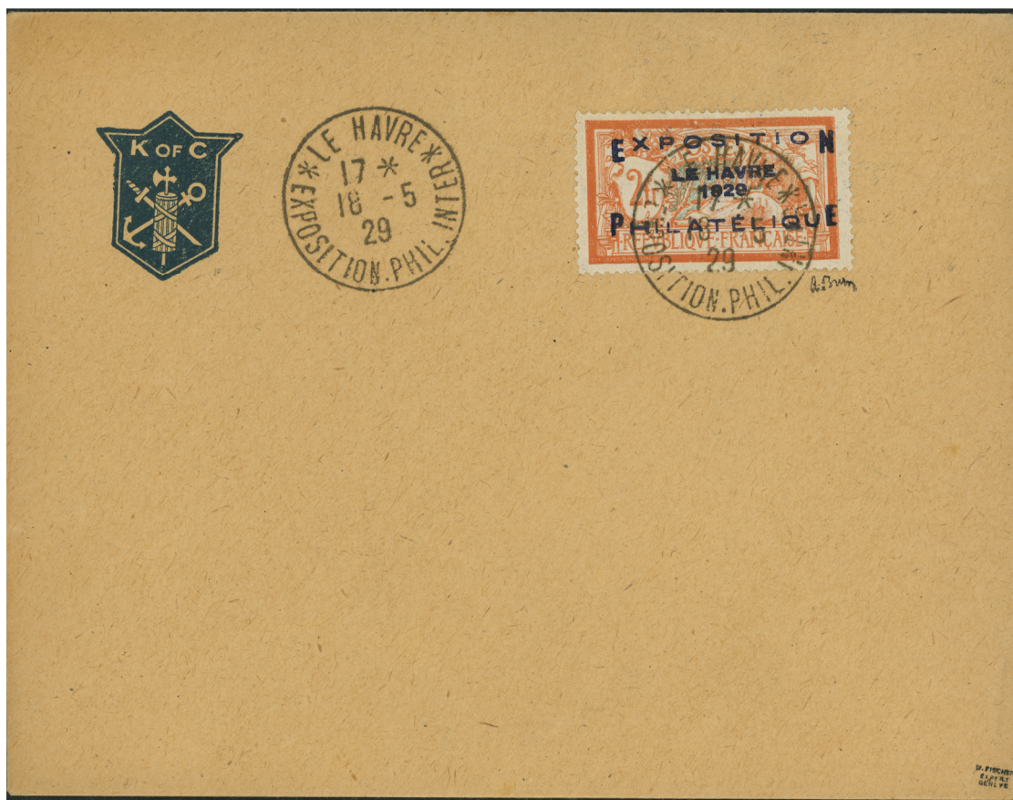
Lettre entièrement falsifiée, surcharge, oblitération et signature A. Brun

Un cachet apposé à la main par un postier, aussi méticuleux qu'il soit n'a pas le même aspect qu'une fausse oblitération, imprimée par un procédé quelconque et reproduite d'après une oblitération authentique. Ceci est valable pour d'autres timbres comme le 2 fr Exposition du Havre, présenté ci-dessous, ou le 5 f Exposition Philatélique de Paris.