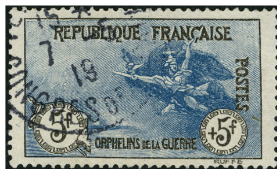
Fausses oblitérations du Congrès de la Paix

Il suffit de regarder les deux oblitérations authentiques ci-dessous. Tous les timbres à date ont été fabriqués en même temps avec le même matériel.