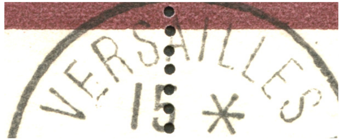
Images agrandies et modifiées pour faire apparaître les différences dans les caractères

Parfois l'oblitération est mise dans un angle, le faussaire s'imagine sans doute ainsi qu'elle n'est pas détectable.